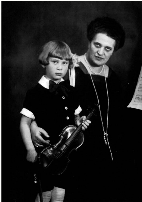
Oolsjen & Mutti